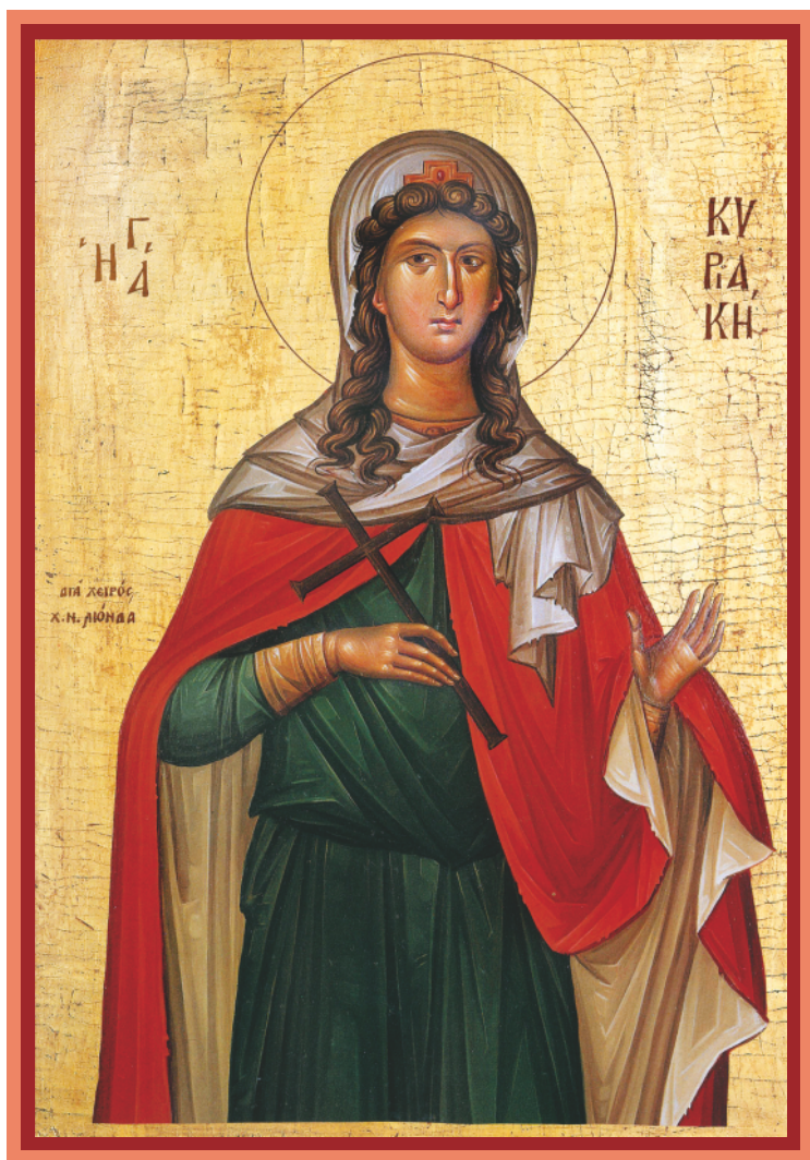
Sfânta Mare Muceniță CHIRIACHI, ocrotitoarea Episcopiei Hușilor